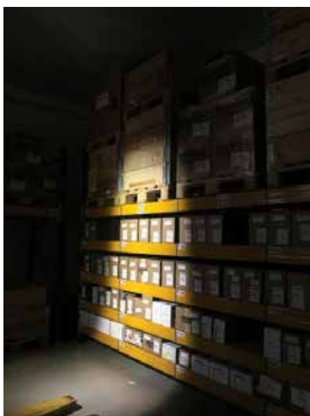
Drive (LED inferiori)