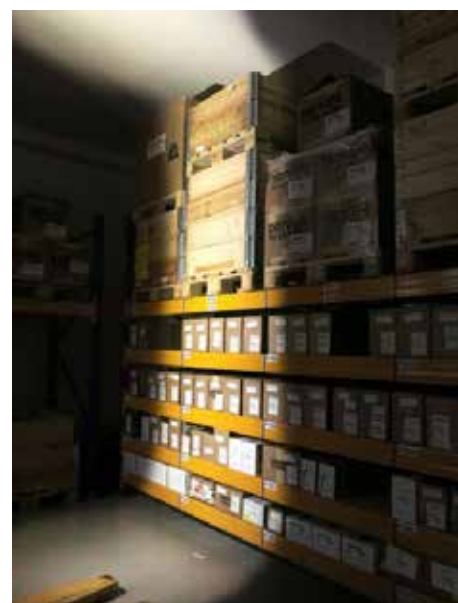
Full (entrambi i banchi LED)